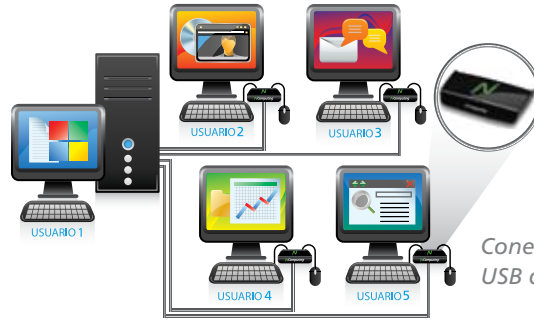
Conecte diretamente às portas USB de um PC