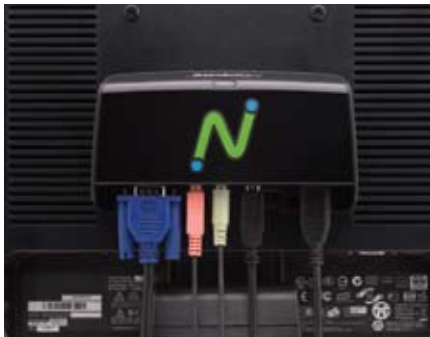
Furos de montagem de 75mm e 100mm compatíveis com VESA (parafusos de montagem incluídos)