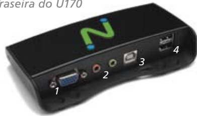
Traseira do U170